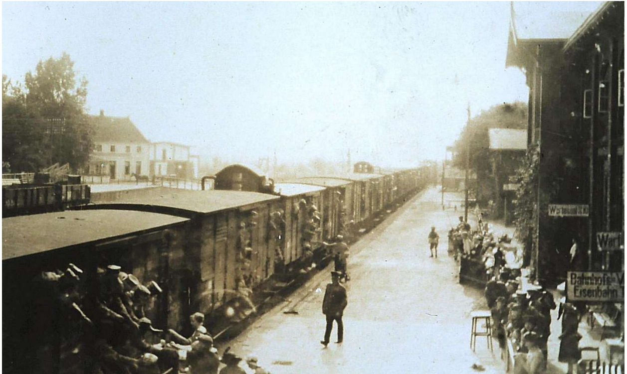
Auf dem Weg zur Front werden im August 1914 durchfahrende Soldaten vom Ottersberger Vaterländischen Frauenverein mit Erfrischungen versorgt

Kaiser es angedeutet haben soll: `Jetzt wollen wir sie dreschen!`.“ 7 Mehrere Fotos belegen die euphorische Stimmung der sich als „vaterländisch“ empfindenden Ottersberger.