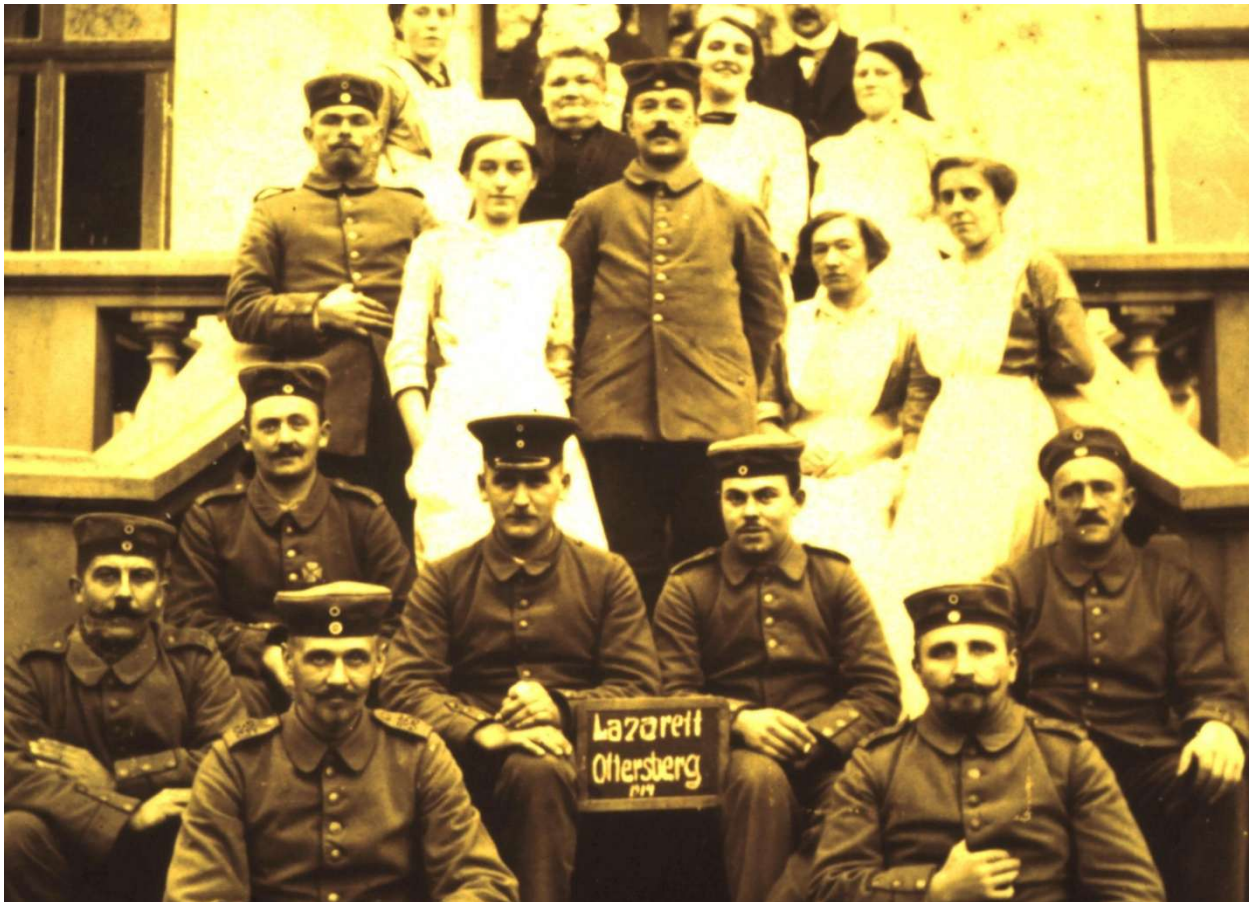
Rekonvaleszenten und Krankenschwestern des Ottersberger Lazaretts im ersten Kriegsjahr. Noch ist die Stimmung gut.

Bis zum Frühjahr 1915 ließen 14 Ottersberger im Krieg ihr Leben. Aber noch gab es ja genügend Ersatz, und so mussten am 29. März zum wiederholten Mal 22 meist junge Männer nach Achim zur Musterung. Von einer Ausnahme abgesehen wurden alle für dienstfähig erklärt und sofort zum Landsturm einberufen.